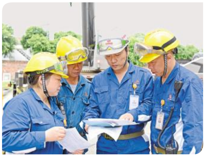
做精做细做实每一件小事