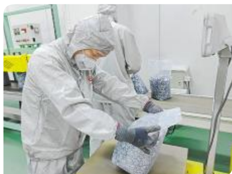
认真专注,保障产品质量

在实现“双碳”征程中,永祥人始终秉持“通威,为了生活更美好”的愿景,扎根平凡岗位,敬业奉献,用坚守与付出,坚定推进晶硅阳光事业,为留住蓝天白云、青山绿水贡献积极力量。