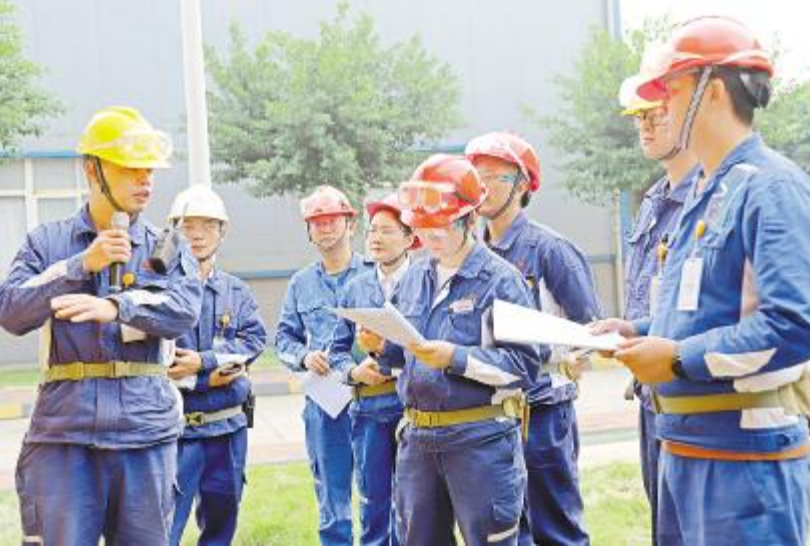
永祥多晶硅抽查员工方案掌握情况

坡- 时候,也' 体现甲乙双方负责人mn工o意T- 时候。强M双方属地负责人- 责任心、施工匠心,] ^ 建设- 全Ito, mn Ito。施工单位. 不断提升Px意T,规范意T,将现场建设班组培训落到实处,JK强措施,严考核,确保 准方案落地不走B。冲刺第四季p,] Xe建设' 头等大事,所有参建人员. f 结( 致、m准施工,强M~ 全,JK抓, p、提速p、强Xe、促~ 全、保节点,坚决按计划完成装置交付, @全面实现k * ) 目mn工o- 全] ^ 建成投产共同努%。