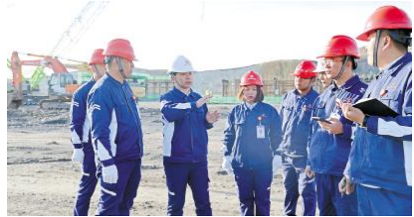
内蒙古通威硅材标准化检查现场

袁总” #, . 始终秉承“~ 全” 所有工作- 前提”理念,~ 全责任书- 层层签订. 从实际出发,把~ 全责任层层压实,> 绕“三管三必须”原则,明确~ 全主责。从员工$培&出发,提P员工~ 全意T,确保执行%- 落地。真a - ~ 全就” 把a确- 措施及时落实到位,各部门. 从“本X~ 全、行@~ 全、过o~ 全”三个维p和~ 全 准M体系做< ~ 全意T提P,让基层员工意T到~ 全' 第( 位。管理层级,切实履职到位, CM~ 全审核,对所有关乎~ 全- 事), 行审查,加大%p, 确保 准切实落地。希望全员不断CM落地~ 全管理方法措施, Y7属于拉棒行] ^ 特色~ 全管理。