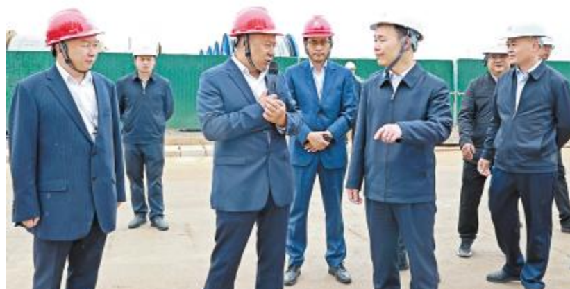
云南省政府副省长、党组成员张治礼一行莅临云南通威视察

10月24日,云南省政府副省长、党组成员张治礼莅临云南通威视察。保山市委副书记市长杜春强,昌宁县县长范正建等陪同。永祥股份