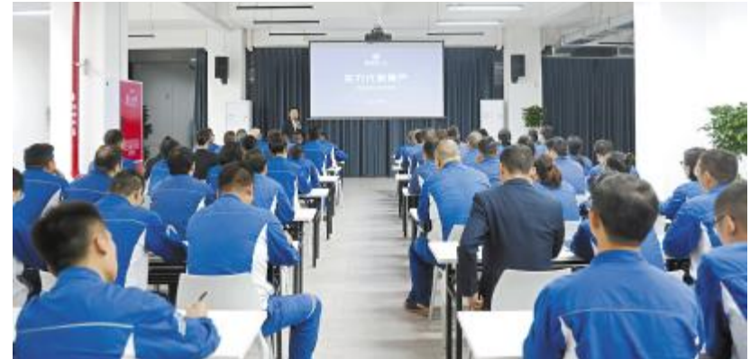
广元通威硅材开展总经理第一课

不可或缺- 根基。E F “红旗班组”评选” @了发扬f g协作m神,激发集体荣誉感,激励全体人员勇争2, , 67比、学、8、9、: - ; < = >, Y7(Z [ \ 技术m、作\ $强、执行任务<、工作^ 率]、~ 全无事故、Xe无缺陷- ! 班组。全员。? “红旗班组”@ AB,CD对、G长HI ,把“红旗班组”Y7成@+, 班组g伍WX提P、全面夯实基础- 重. 抓手,@公司] Xe发F提供坚实保障。