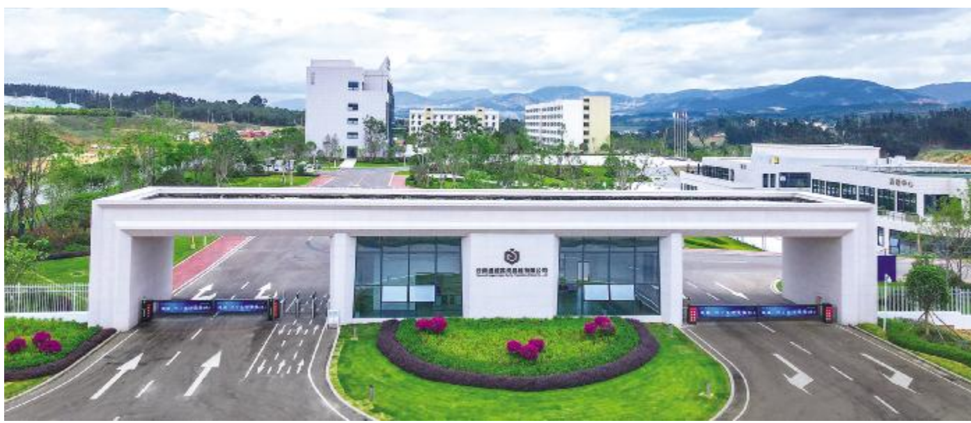
云南通威花园式工厂