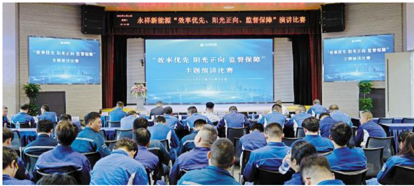
永祥新能源举行“效率优先 阳光正向 监督保障”主题演讲比赛