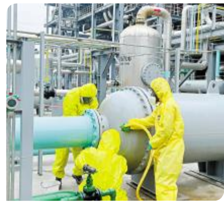
日常演练,保障安全

身其中,不断提升工艺水平,推动绿色可持续发展。我们将坚守岗位,全身心地投入到这个伟大事业中,为实现碳达峰碳中和贡献自己的一份力量。中国梦就在前方!让我们更加紧密地团结在一起,为建设绿色、美丽中国作出更大贡献。