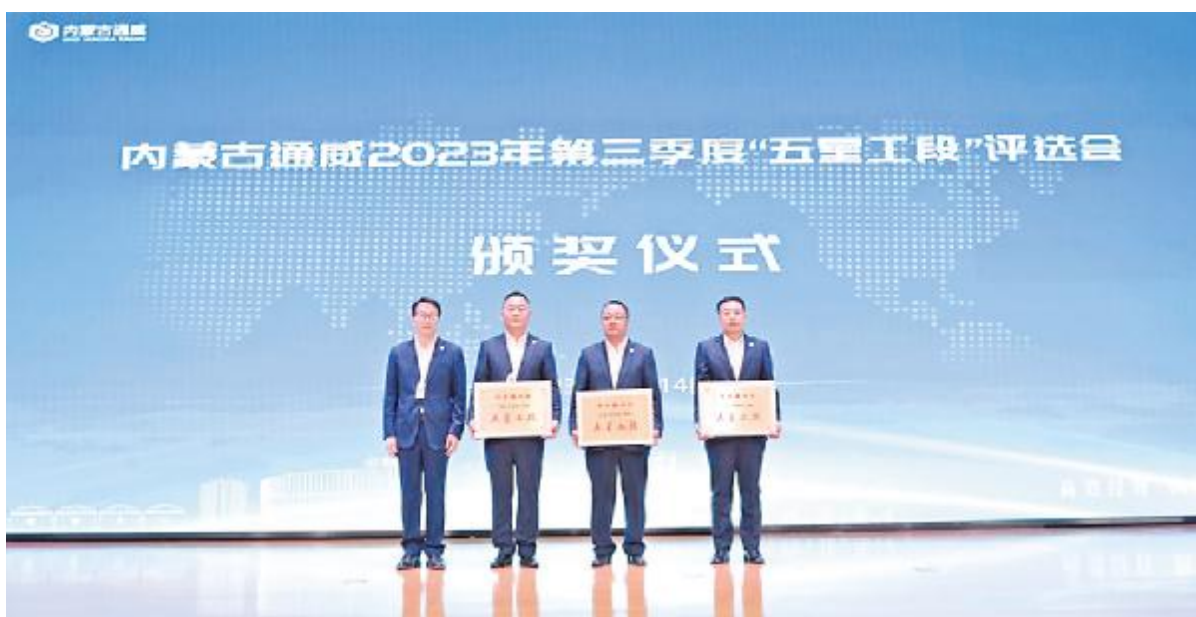
内蒙古通威举行2023年第三季度“五星工段”评选会

记者 钟继辉 通讯员 杨娟 李福超 杨树芬 陈怡迪 胡裕 胡尧 喻镭 陈霞 许文娟 王玮华 杨彦超