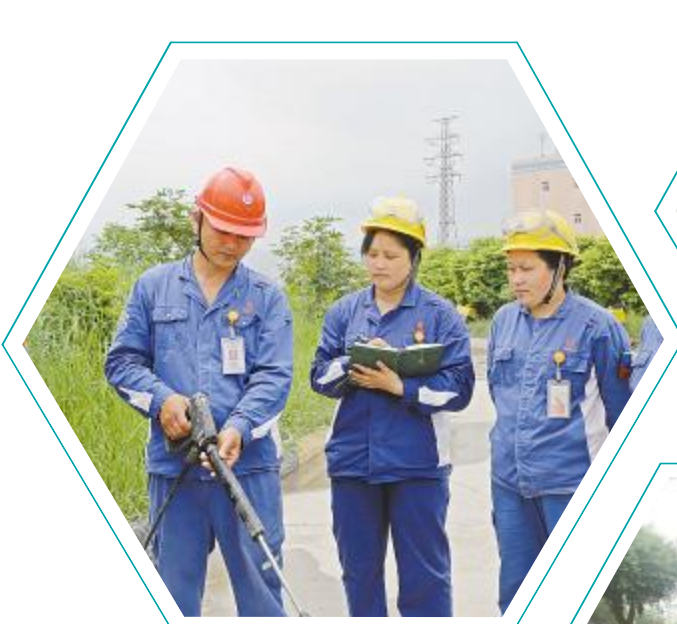
永祥新材料 取样组