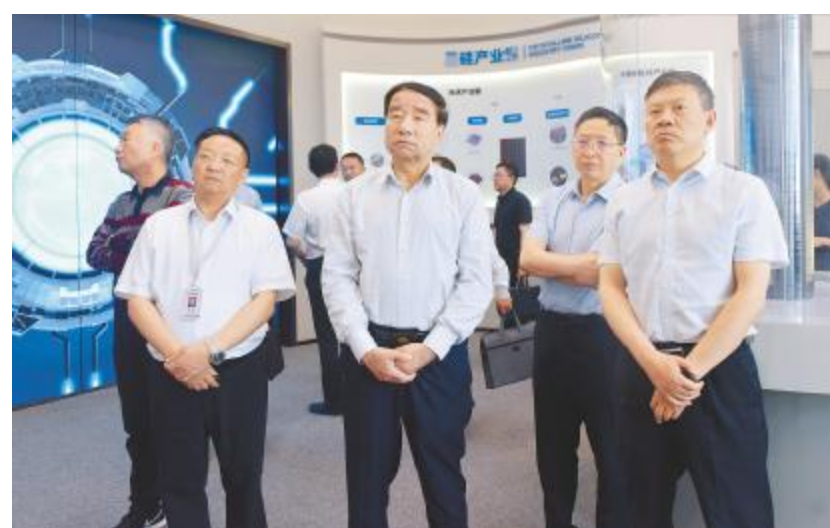
新疆维吾尔自治区政协副主席艾则孜·木沙在永祥股份考察