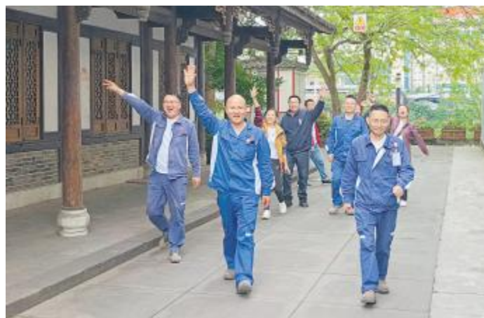
徒步活动有益身心