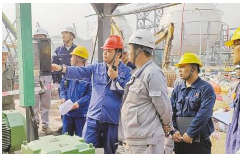
永祥能源科技全厂首次送电试取圆满成功