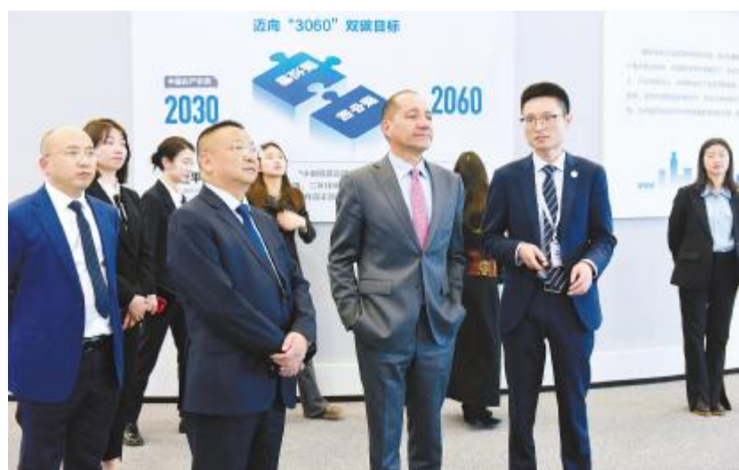
厄瓜多尔驻华大使卡洛斯·拉雷亚在永祥股份参观