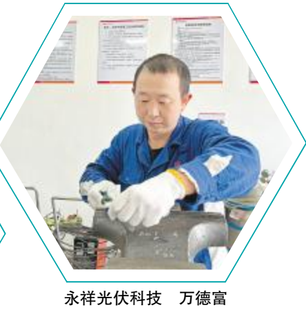
永祥光伏科技 万德富