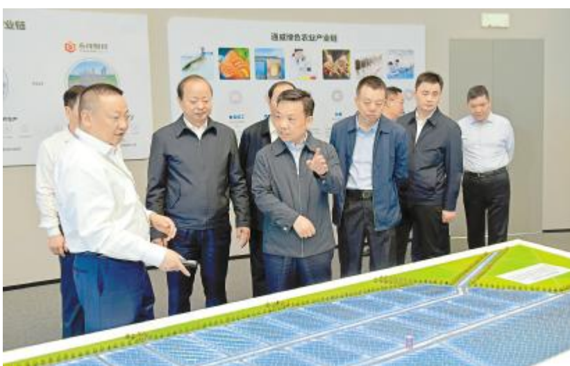
四川省委常委、政法委书记靳磊在永祥股份调研