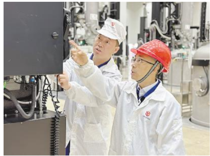
永祥光伏科技开展合炉标准检查