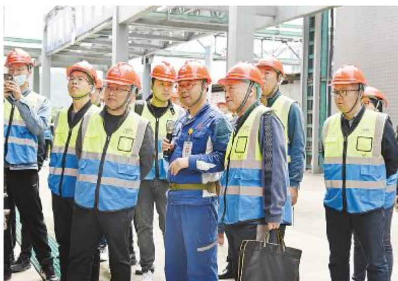
中国化学工程集团实业安全培训班到访永祥树脂参观