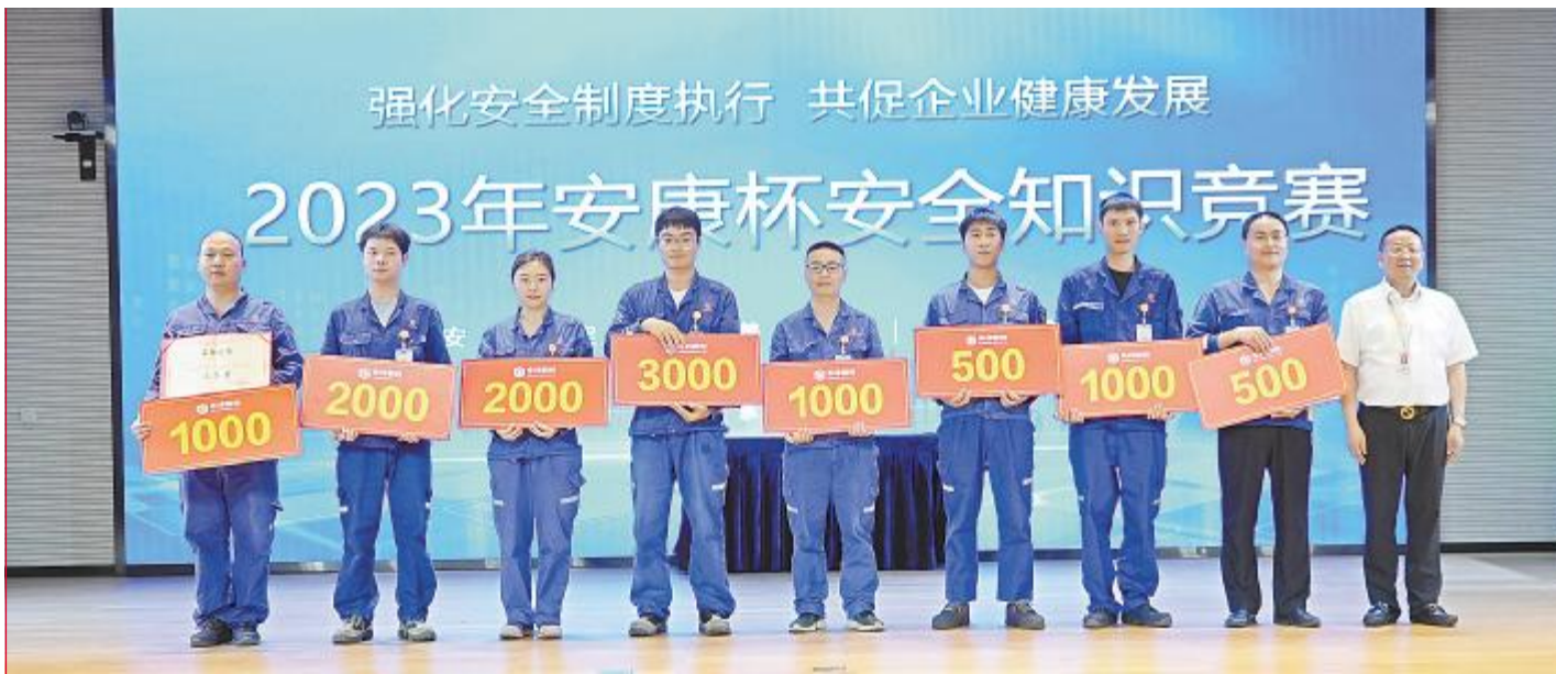
永祥新能源举办2023年“安康杯”知识竞赛

记者 刘奕锋 通讯员 杨彦超 陈欣悦 胡尧 吴旭娇 喻镭 周海容 杨树芬 林心喻