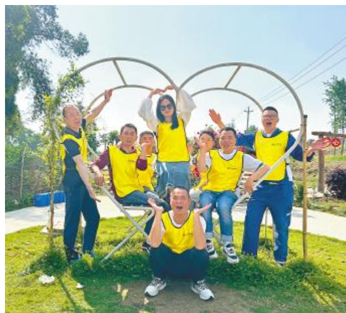
户外拓展凝聚团队力量