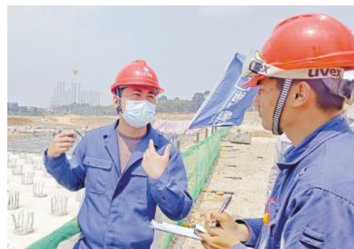
不惧烈日,建设现场有你有我