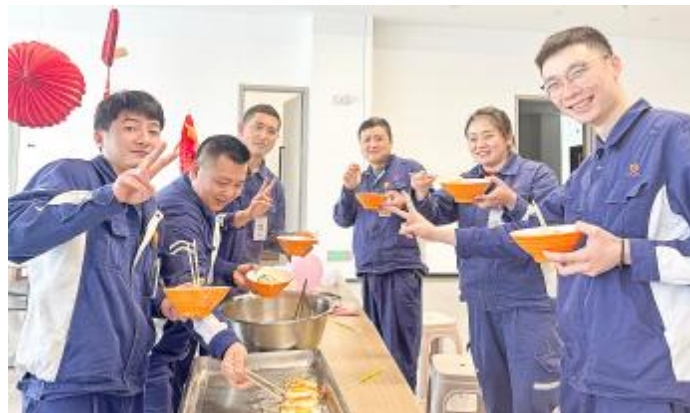
集体生日会其乐融融