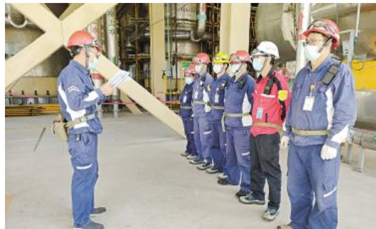
云南通威 回收二班