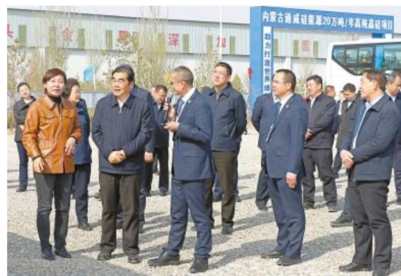
内蒙古自治区党委常委、包头市委书记丁绣峰听取项目介绍

“项目发展潜力巨大,活力无限。”观摩团领导在建设现场纷纷表示,通威作为首家落户包头的光伏行业上游硅料龙头企业,感受到了通威对产业链提升的带动能力,并看好内蒙古通威硅能源的发展前景,对项目信心十足。丁绣峰书记鼓励公司继续抓好经营管理、加强技术创新,进一步推动光伏产业链发展,为巩固推动经济高质量发展贡献力量,并表示,政府职能部门将加强与企业的沟通,主动做好各项服务保障,帮助企业协调解决项目建设中存在的困难与问题,为企业发展创造良好环境。